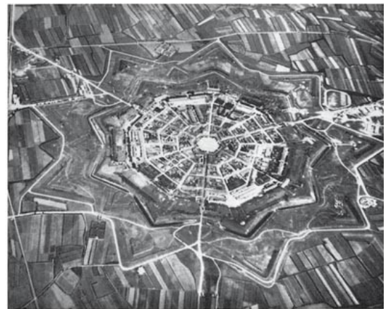
16.5. Vincenzo Scamozzi (?), Palmanuova, Itália, iniciada em 1593. Palmanuova é uma cidade planejada construída de acordo com modelo circular ideal.

Os arquitetos renascentistas buscavam dar forma ao espaço usando unidades modulares baseadas nas relações proporcionais entre números inteiros. O círculo e o quadrado se tornaram os módulos básicos de sua arquitetura, e seus limites eram delineados por colunas clássicas, arcos e entablamentos derivados de fontes romanas. A beleza era considerada como a disposição cuidadosa de partes proporcionalmente relacionadas. O arquiteto humanista e teórico da arte Leon Battista Alberti (1404-1472) oferece esta síntese em seu livro De re aedificatoria , escrito por volta de 1450: "A beleza é a harmonia racional entre todas as partes de um corpo, de modo que nada pode ser adicionado, retirado ou alterado, senão para piorar". 8 Ecoando Pitágoras, Alberti estava convencido de que "os mesmos números, com fazem que os sons tenham conciuntitas , com-